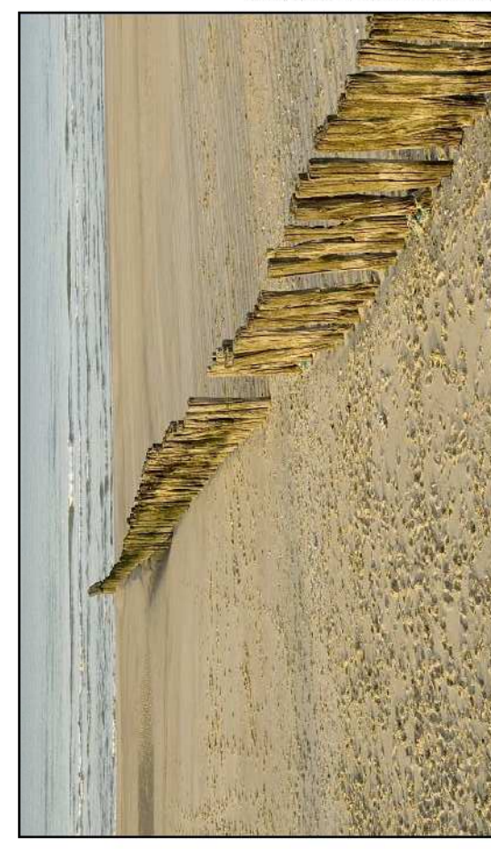
Cotes de référence