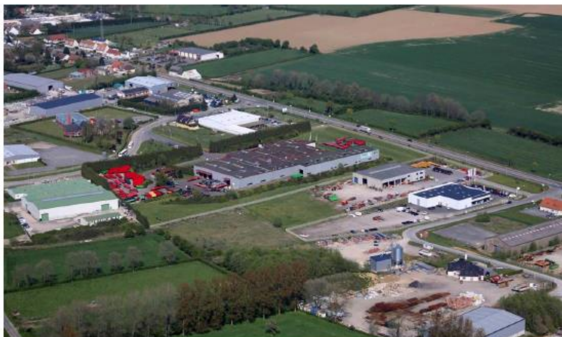
La petite Dimerie a désormais tout d'une grande, elle n'a pas fini sa croissance (photo Agence d'urbanisme et de développement de la région de St-Omer),

La configuration de la ville de Fruges est en un point similaire à celle de Saint-Pol avec un axe routier très fréquenté, étroit et présentant un danger certain. La RD 928 est de ce point de vue un handicap. Ils sont nombreux les usagers de la route à traverser... très peu à s'arrêter. Par contre, pour la ZAL, l'axe devient un atout, de par son transit important. C'est l'un des axes structurants du département.