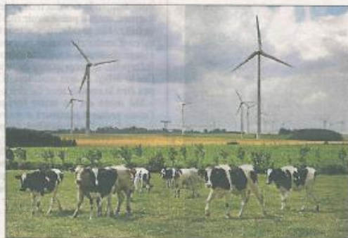
D'ici peu, Ostwind et la communauté de communes espèrent que le parc frugeois atteindra les cent machines.