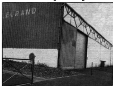
La friche Legrand va être réhabilitée et la toiture devrait accueillir des panneaux photovoltaïques

Pour en finir avec le rayon aménagement, l'intercommunalité va signer une convention avec l'Agence d'urbanisme et de développement de Saint-Omer pour un montant de 80.000 euros. Cette structure apportera une expertise et un sou-