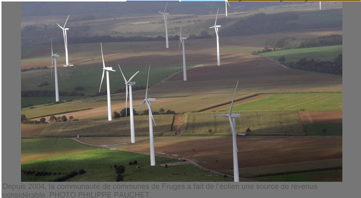
Depuis 2004, la communauté de communes de Fruges a fait de l'éolien une source de revenus considérable.

PARTAGER TWITTER Le journal du jour à partir de 0.79€