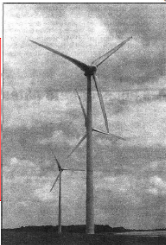
Une quinzaine d'éoliennes supplémentaire sur le territoire.

Le Schéma de cohérence et d'organisation territoriale se poursuit et pourrait voir le jour dans le cadre du syndicat mixte Lys - Audomarois. Comme on l'a expliqué un peu plus haut. La phase finale du plan intercommunal