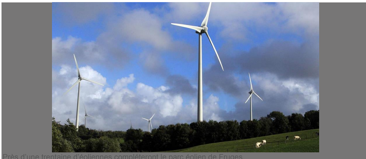
Près d'une trentaine d'éoliennes compléteront le parc éolien de Fruges