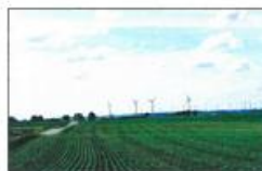
Les rencontres énergies sont organisées en partenariat avec Ostwind, à l'origine du plus grand ensemble éolien de France avec -pour le moment- 70 machines.

Vendredi : 9h30/16h30 Samedi : à partir de 10h. Entrée gratuite. Salle Rougé. ■