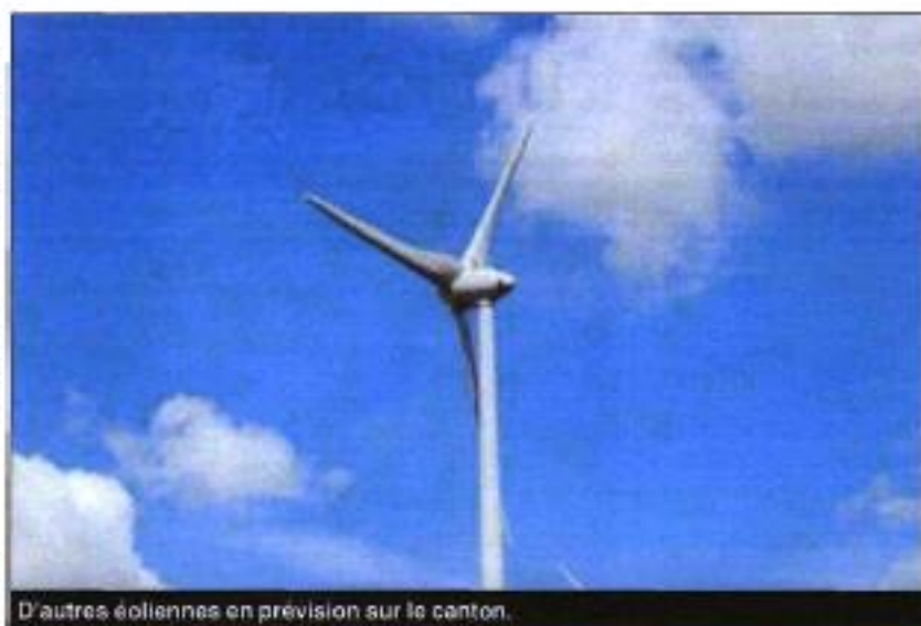
D'autres éoliennes en prévision sur le canton.

« Le nombre de machines n'est pas défini car l'état accordé des puissances. Nous allons demander la révision de ce schéma régional puis-