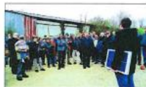
En avril dernier, EnergETHIC inaugurait la première centrale photovoltaïque citoyenne du Pas-de-Calais.

mission bois-énergie qui vise notamment à accompagner les collectivités ou particuliers dans des projets de chaudière à plaquettes de bois mais aussi à sensibiliser le grand public à cette thématique (via des conférences ou des visites d'établissements disposant de ces chaudières). ■