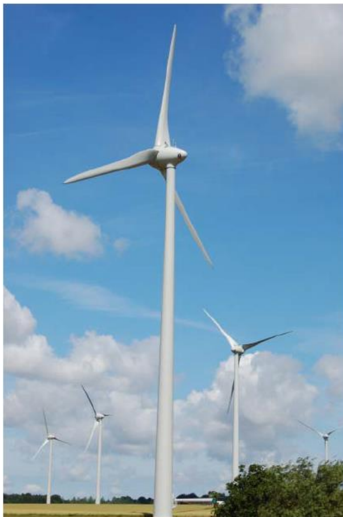
De 70 machines, le parc éolien frugeois devrait passer à 89.

vain Verrière, chef de projets chez Ostwind, a donc tenu une permanence publique la semaine dernière à la mairie afin d'informer les habitants sur la modification du projet et rappeler.