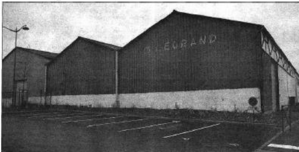
La friche Legrand sera réhabilitée et comportera des panneaux photovoltaïques.